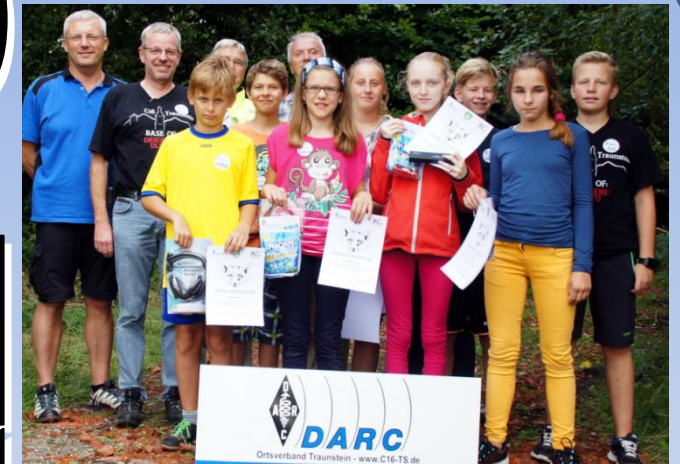
Fuchsjagd im Ferienprogramm der Stadt Traunreut - „Zielfoto“ vom 21. August 2015 -

Deutscher Amateur-Radio-Club e.V. Bundesverband für Amateurfunk in Deutschland